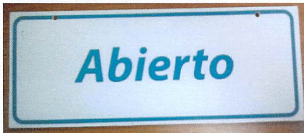
Vinil adhesivo sobre sintra 3mm.