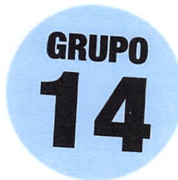
Sticker Número de Grupo