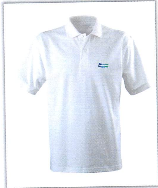
Polo tipo Dry-Fit color Blanco C/Logo Promese/Cal para Caballeros y Damas