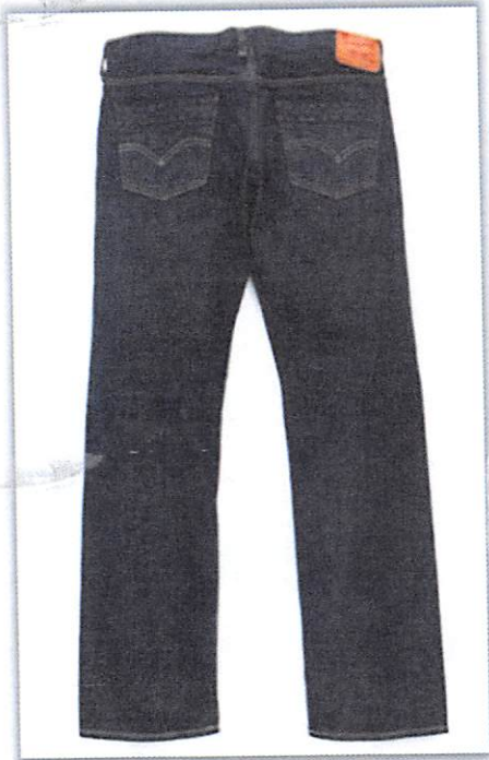
Pantalón Jean color azul marino C/Logo Promese/Cal en el bolsillo tracero, dos bolsillos lateral y dos bolsillos trasero