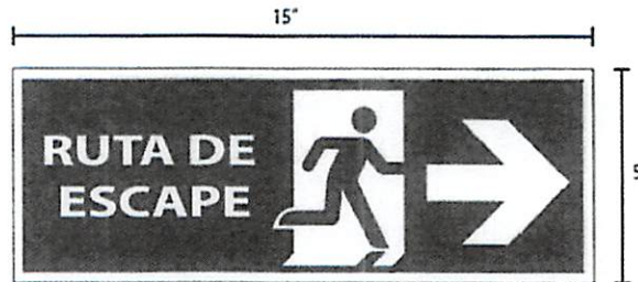
Señalización Ruta de evacuación a la derecha

SEÑALETICA FOTOLUMÍNICA DURACIÓN HASTA 2 HORAS ENCENDIDA MATERIAL FLEXIBLE ( ESTIRENE) CAPA PROTECTORA DE SEÑALETICA MEDIDAS 15 PLG X 5 PLG